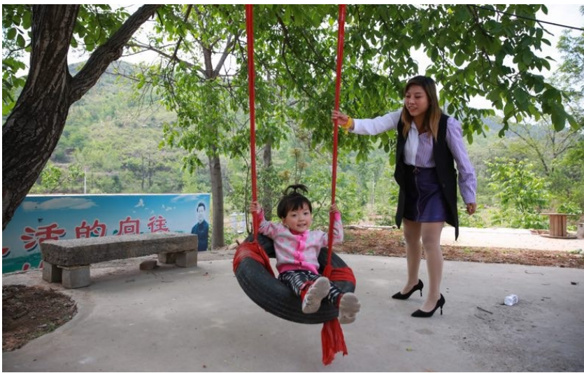
游客在张家庄村玩耍。