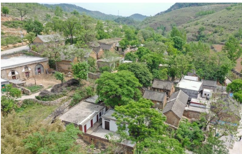
张家庄村古村落航拍图

绿水青山就是金山银山。我们的乡村振兴,还是要依托张家庄村现有的绿水青山,按照“一村一品”的原则规划,把特色产业做大做强,把自己的特色发挥到极致。