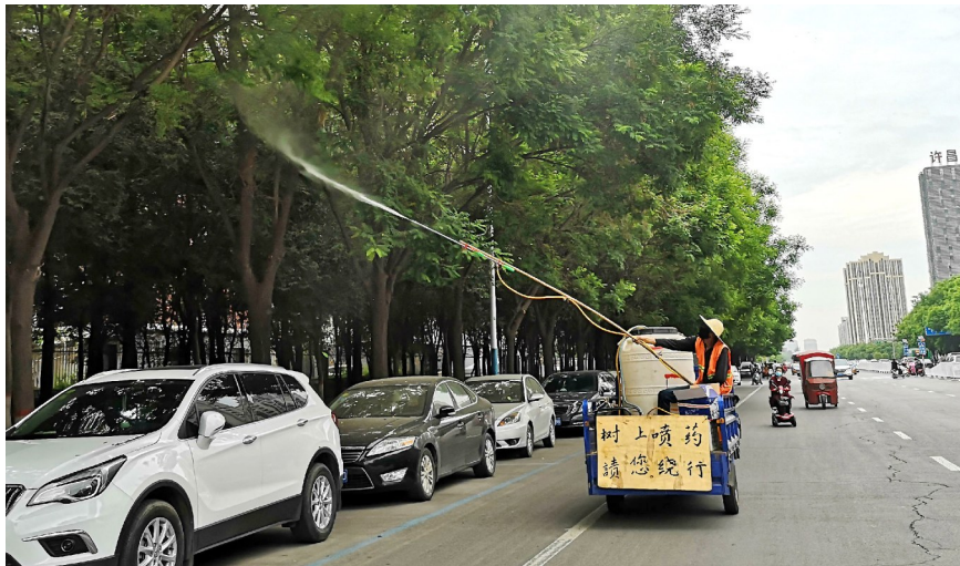
东城区八龙路,园林工人正在向行道树喷洒药剂。资料图片

“我在今年3月又发现有人转发这类信息,并和林业部门的工作人员进行了探讨。这类信息在我国多个城市出现过,官方也多次辟谣。”郭忠磊说,据他了解,美国白蛾幼虫会在夏末和秋季织网状巢,是国际自然保护联盟公布的百大外来入侵物种之一,对东亚造成仅次于松材线虫的危害。