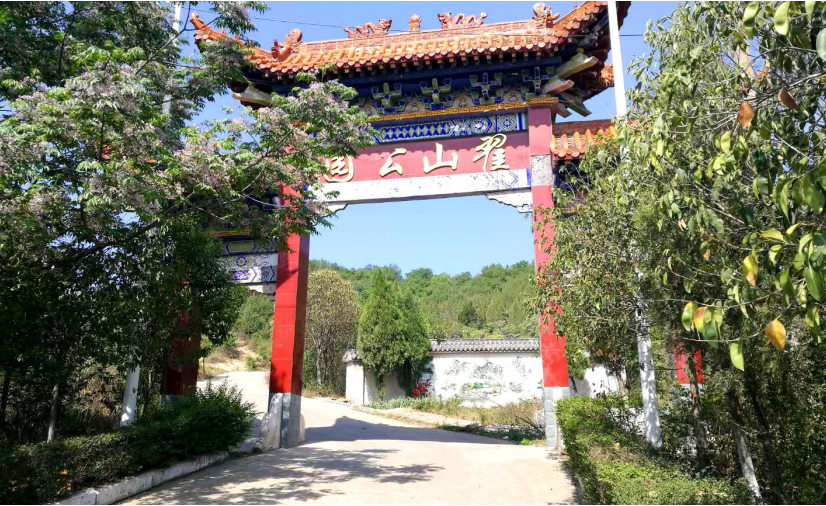
陈南村翟山公园