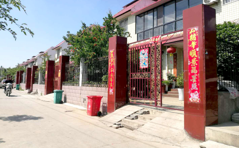
陈南村统一修建的联排别墅

希望在不久的将来，陈南村可以在生产、生活、生态协调发展以及乡村治理、改革创新等方面，给其他地方提供可复制、可推广的宝贵经验。