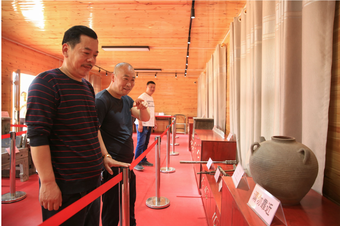
游客在大木厂村乡愁博物馆参观。

“我们注册成立了大木厂乡村旅游发展有限公司，挖掘了当年知青下乡的故事，规划建设了知青旧居；依托西部山上的防空洞，规划建设了宣誓广场，并修建了巨大的