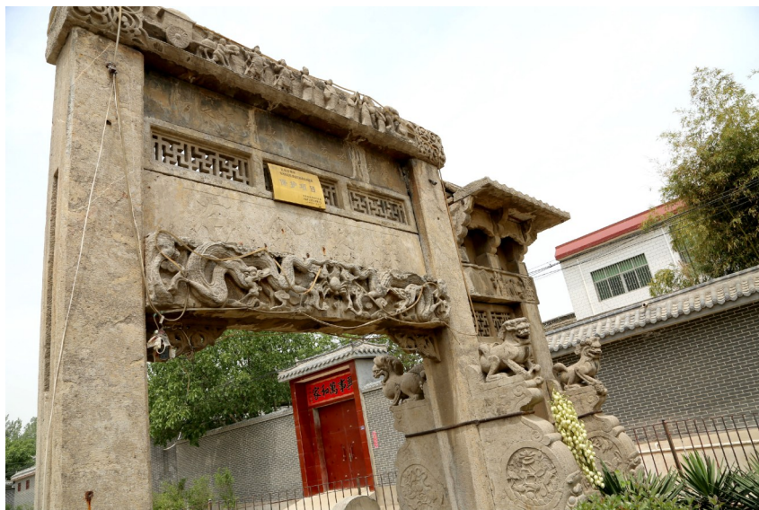
乔黄村里的牌坊

通过“美丽乡村”建设，我们村的环境得到了较大提升，主街道栽种的各种果树让村庄四季都有景色。环境好了，村民的精气神也足了。依托建筑机械制造，村里具有一定的产业基础。下一步，我们将重点谋划集体经济，传承孝道文化，打造具有文化品位的产业村。