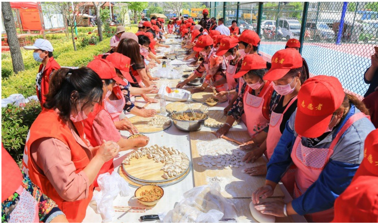
义女社区第三届孝道文化节，志愿者在包饺子。

承为突破口，从尊老、敬老、养老，到爱人、爱国，倡导举止文明、诚实守信、举孝兴廉、担当责任，增强了社区群众的凝聚力，为乡村振兴提供了坚强的精神支撑。