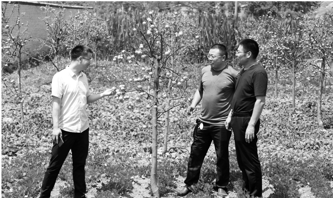
柿张社区荒地上栽种的果树

近年来,该社区把丰富村民文化生活与思想文化阵地建设相结合,通过建设图书阅览室、活动室,在群众中开展