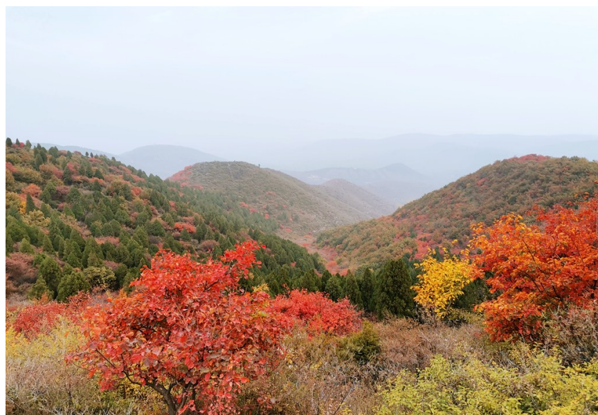
关庙村大汪沟的红叶美景

我们村以前由于地理位置等原因,是个有名的穷村,穷得连村里的人都留不住。经过这些年的发展,村里的石头山路变成了平整的水泥路,原先的荒山种满了植被,各类配套设施齐全,还建设了好几处文化休闲场所,村民的生活环境有了翻天覆地的变化。现在,我希望村里的旅游业和集体经济赶快发展起来,吸引游客观光和消费,让大家的生活更上一层楼,让年轻人回村挣钱。