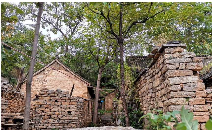
关庙村的古民居

缝里刮土,再将一个个树坑填满,以便来年开春好栽树。有时候为刨出一个树坑,他往往需要花费一个多小时。其他包山的村民也有样学样,纷纷在各自的山头刨坑培土。