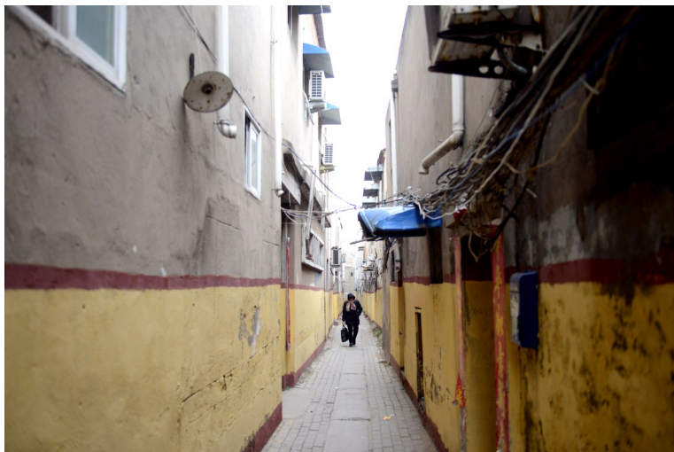
1月2日,一名市民从北臧胡同经过。记者 牛志勇 摄