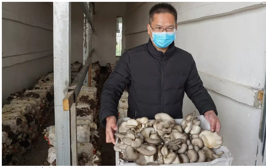
耿新要在车间里忙活。

下了订单,预计可以收获6万斤,为村集体经济增收5万元到7万元。试种成功后,我们计划在全村大力推广平菇种植,