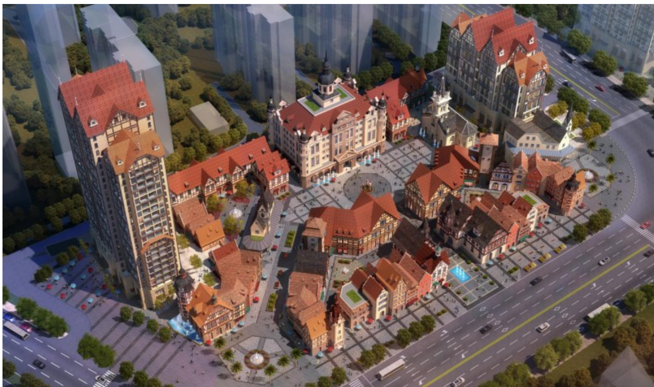
德仕堡生活广场效果图