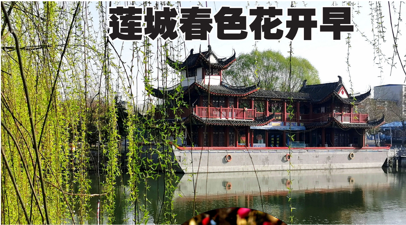
↑ 西湖公园翠柳拂堤。

本报讯(记者毛迎文/图)3月11日,天气晴朗。春天的阳光裹挟着温暖的气息,空气里飘荡着淡淡的花香,像是在提醒人们:春天来了!