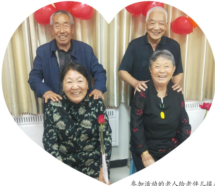
参加活动的老人给老伴儿揉肩。

“我们会对合影进行剪辑，做成结婚照的样式发给老人。”孙亚鹏说，通过这次活动，幸福社区的幸福老人收获了快乐，引领“珍惜爱情、互亲互敬”的美好新风尚。