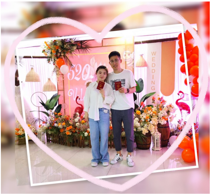
一对新人在美丽的魏都区婚姻登记处拍照留念。

本报讯（记者 代玺 文/图）既是小满，又是“5·20”的2020年5月20日，你得到告白和礼物了吗？5月20日原本是平凡的一天，但因为“五二零”谐音“我爱你”，华丽变身为一个浪漫的日子。5月20日，记者从市民政局获悉，我市当天近200对新人领证“官宣”。魏都区婚姻登记处为满足广大市民的结婚登记需求，结合当前新冠肺炎疫情防控要求，提前谋划，精心部署，确保登记领证工作平稳、有序、安全进行。