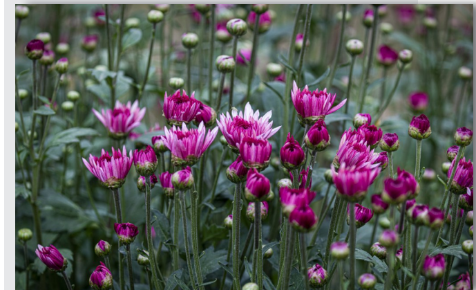
姹紫嫣红 晨报摄友 杨望祥 摄

因为爱摄影,所以我们用镜头定格打动心灵的瞬间,镜头就是我们的眼睛。我们爱翻看相册,爱看那些凝固的影像,因此特开设《摄友》版面,为专业摄影师和摄影爱好者提供一片天地。欢迎大家踊跃来稿。