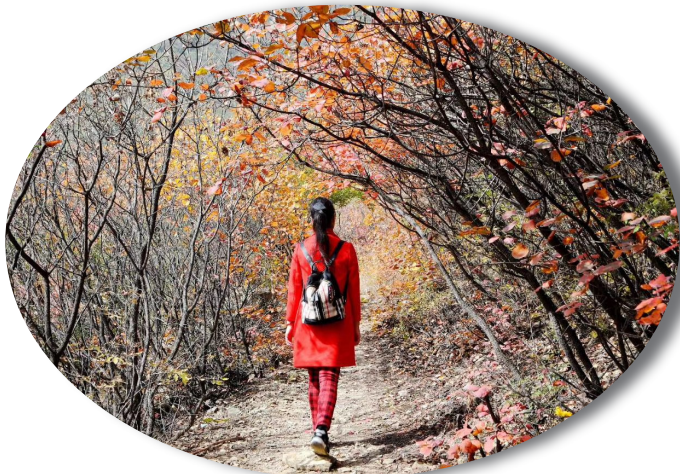
林中漫步

秋天既是银杏叶与梧桐叶比美的季节,也是菊花绽放的季节。彩菊给大自然带来无限生机和美感,也为我们带来好心情。生活充满温柔的点滴。认真缝制衣服的老人、在红叶间漫步的女子是生活中再平常不过的画面,但是用镜头定格下来回看的时候,心中总会荡起温柔与幸福的涟漪。也许这就是摄影的魅力吧! (李翊飒)