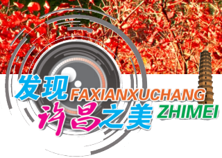
不管是春夏还是秋冬，大自然总能呈现出它的美。