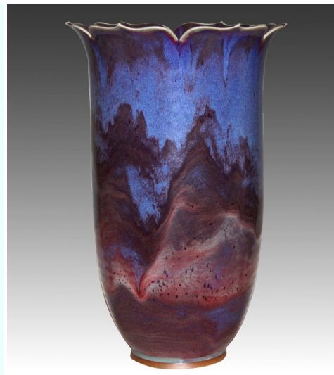
李向阳作品《般若樽》