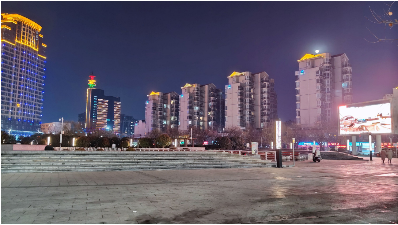
1月1日21时6分的文峰游园