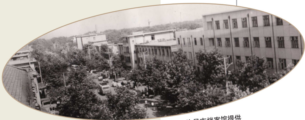
1970年,七一路西段。图片由许昌市档案馆提供