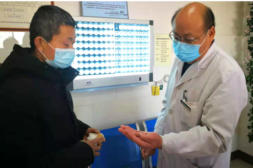
许昌市人民医院呼吸与危重症医学科主任为患者诊断后,告诉患者要正规服药。

支气管哮喘、慢阻肺、肺间质、睡眠呼吸障碍……一次顺畅的呼吸对患者来说无比奢侈。 为了更好地治疗患者,让患者可以