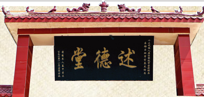
大慕庄文化大院牌匾。