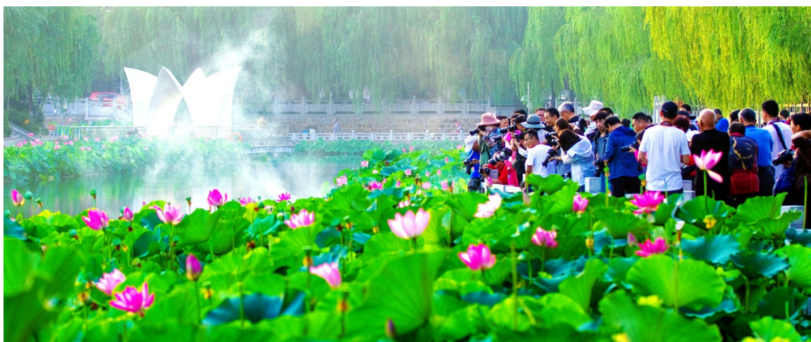
聚焦护城河