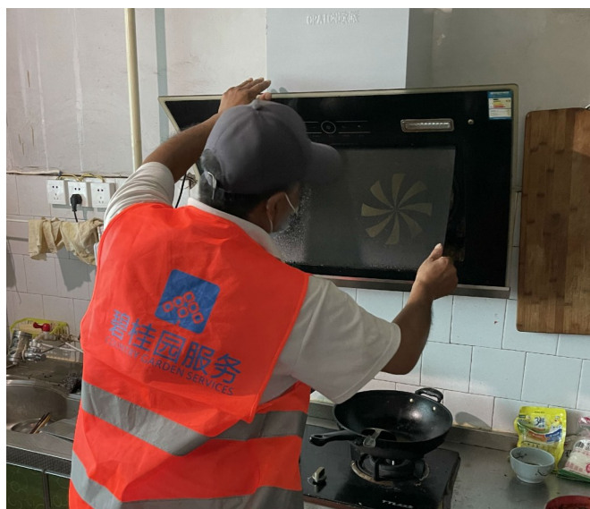
物业人员为业主清洗抽油烟机。