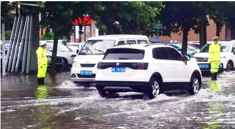
长葛市公安局交警大队民警在雨中执勤。