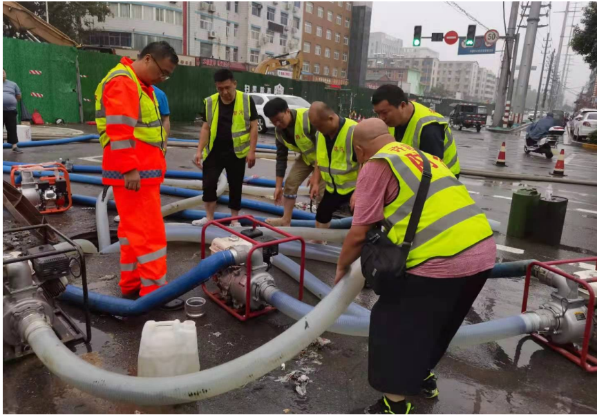
上图:市政工人在临时抽水点忙碌。

雨情就是命令。这场大雨是对我们安全度汛的一场考验。那么多部门、那么多人员坚守岗位,接受暴雨的挑战,接受群众的“检阅”。他们或许并不强壮,但是毅然坚守的身影成为暴雨中的“定海神针”。