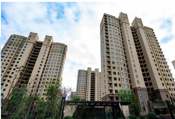
北海·腾飞花园景观。