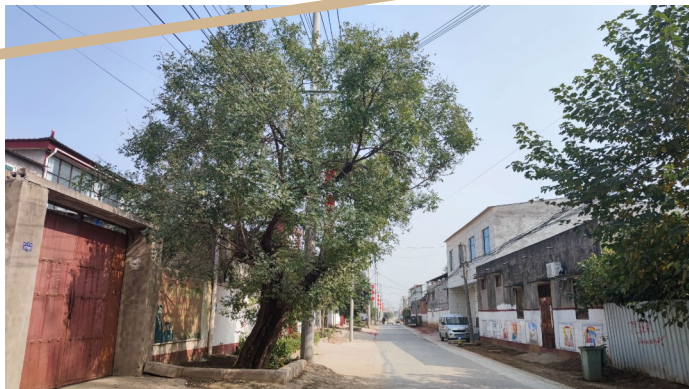
岚川府村街头的古槐树。

由此可见,位于双洎河两岸的岚川府、四三府都是当时周王藩外迁的宗室人员所建。这也印证了明朝时凡是朱姓皇室人员居住之地皆称“府”的传说。