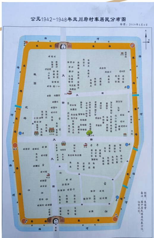
朱国营绘制的岚川府寨居民分布图。