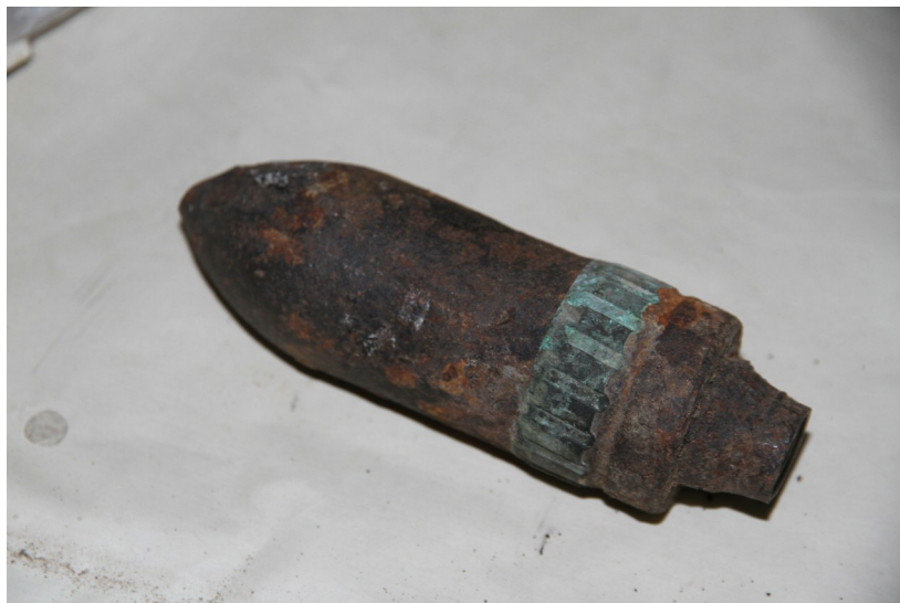
从文峰塔内取出的炮弹。资料图片