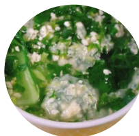
荠菜豆腐丸子 资料图片