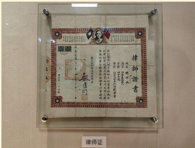
许昌市档案馆展示的《律师证书》