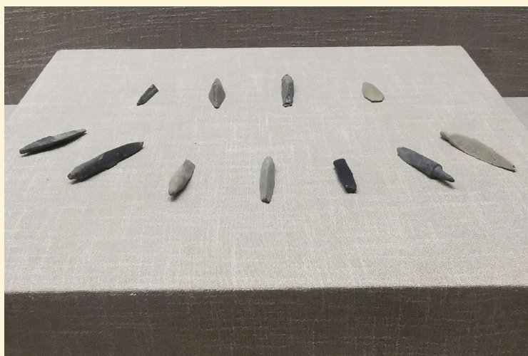
禹州瓦店遗址出土的石镞