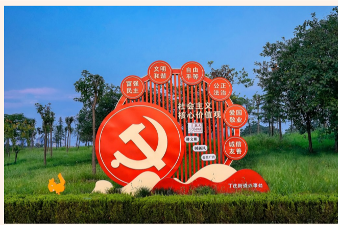
加强党的建设永远在路上