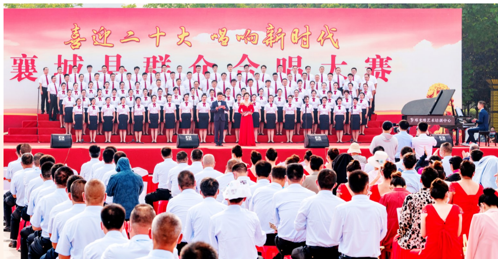
“喜迎二十大 唱响新时代”襄城县群众合唱大赛现场