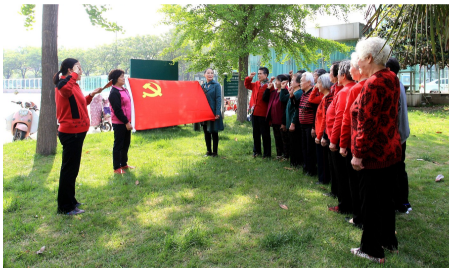
许昌卷烟厂老年党员重温入党誓词