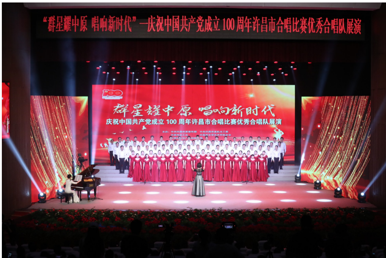
许昌市隆重举办庆祝中国共产党成立100周年文艺晚会