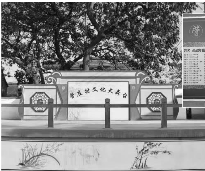
▲ 襄城县颍阳镇菅庄村才子榜 ▼ 菅庄村文化大舞台

“菅”的本意是一种植物，《说文解字》释：“茅也”。“菅”指菅茅，多年生草本植物，很坚韧，茎可做绳织履，细细的茎叶可以覆盖屋顶，也可做炊帚、刷子等。