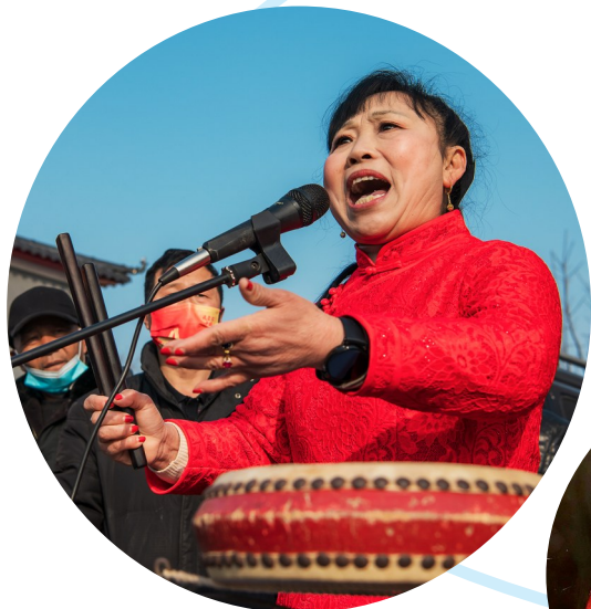
声情并茂