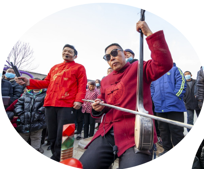
各展绝活儿