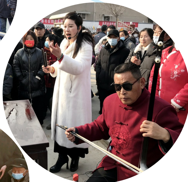
一板一弦唱尽古今往事