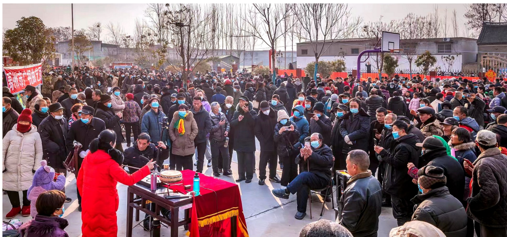
书会一隅