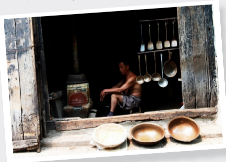
摄于襄城县明清古街