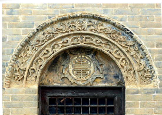
摄于禹州市浅井镇扒村