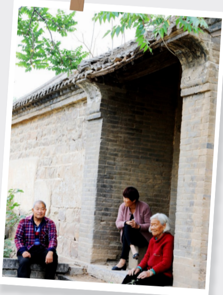
摄于禹州市浅井镇陈桐村