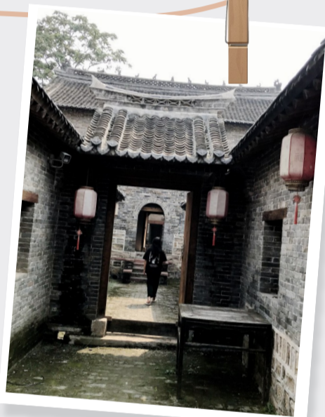
摄于禹州市神垕镇义泰兴老宅