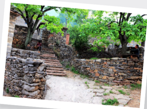
摄于禹州市鸠山镇