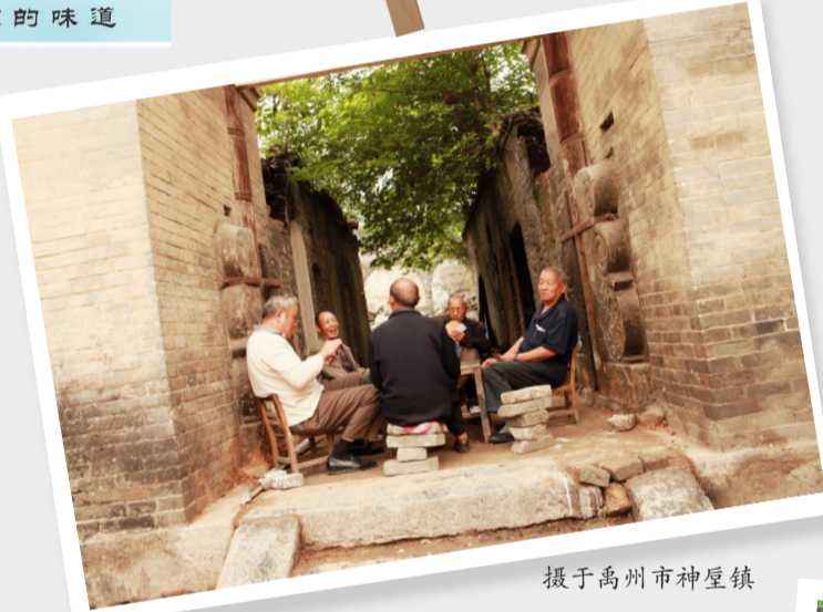
摄于禹州市神垕镇