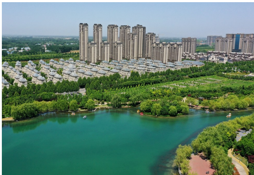
恒达·北海龙城实景图

面对新的五年、十年……恒达集团未来之路任重而道远。恒达集团将秉承一贯的奋进精神与创业情怀，把握市场与行业的发展趋势，为企业注入持续动力和旺盛活力，在保持自身高质量发展的同时，积极承担社会责任，强化运营力，夯实产品力，持续服务力，以坚定自信的步伐前行，做时代的参与者、行业的奋进者、社会发展的开创者!