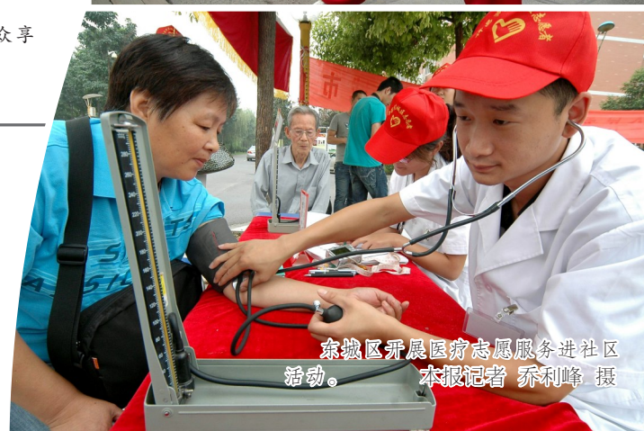
东城区开展家庭医生服务进社区活动。