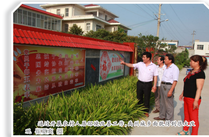
通过开展农村人居环境整治工作,禹州美丽乡村得到很大改观