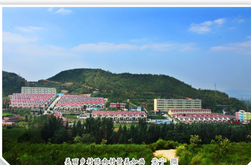
美丽乡村建设带动乡村旅游