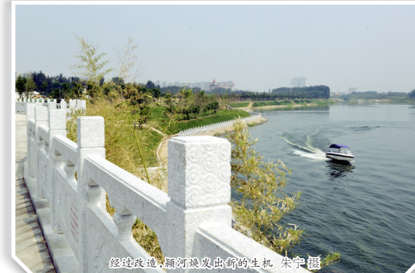
建设提质,颍河风光带新景观