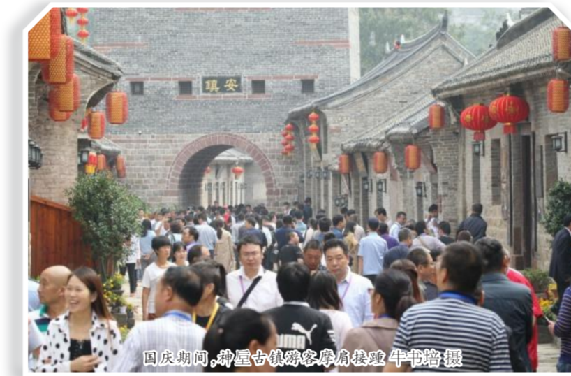
国庆期间,神垕古镇热闹非凡