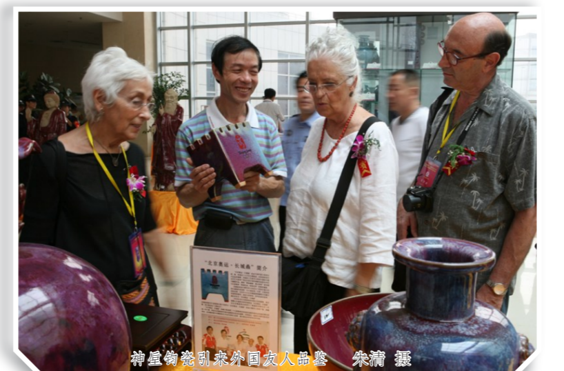
神垕古镇吸引外国友人品鉴