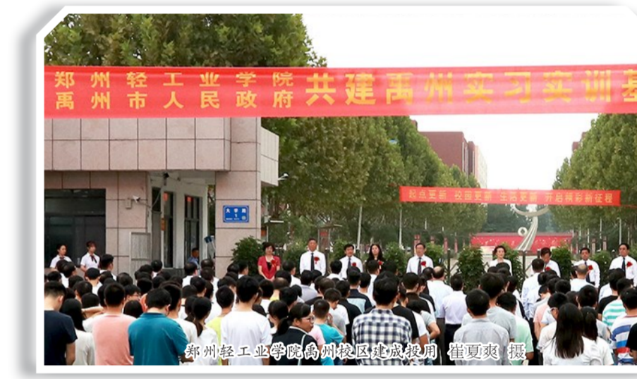
郑州轻工业学院与禹州市政府共建禹州实训实训基地