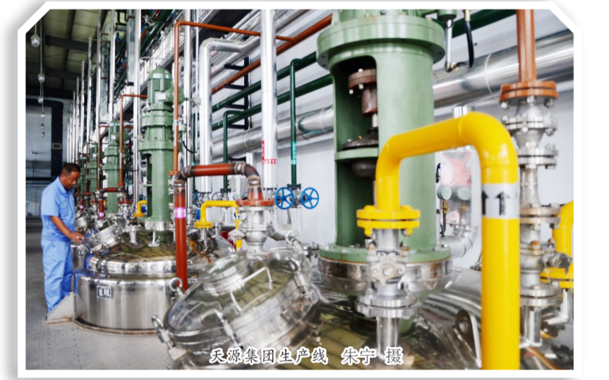
阜康集团生产线