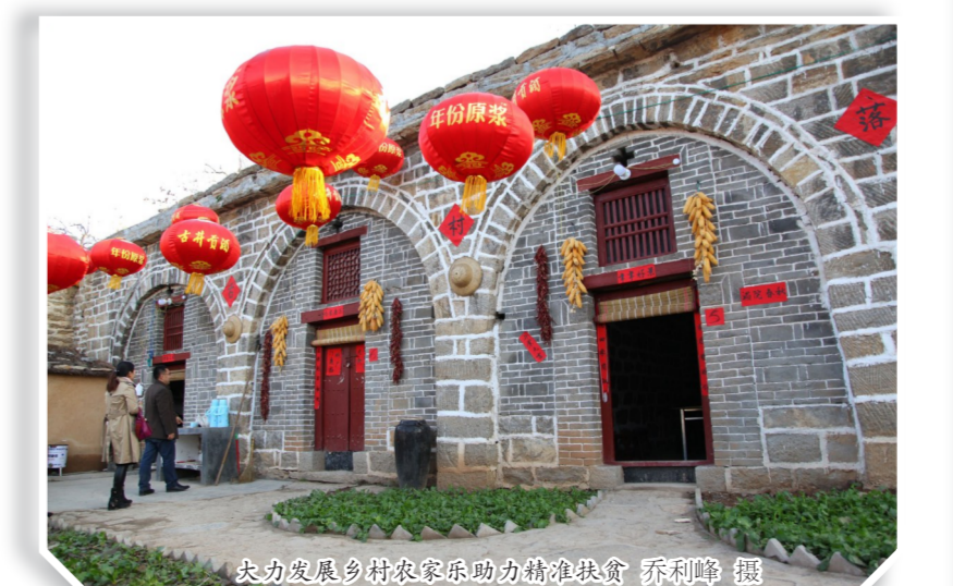
大力发展乡村旅游带动农民增收