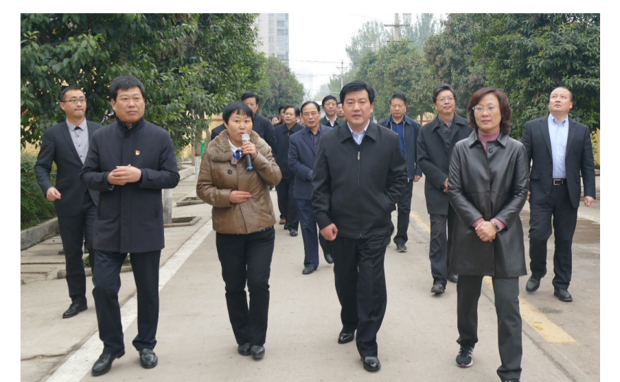
禹州市市长范晓东(前排右二)在颍川办事处寨子社区调研

10月9日的《人民日报》公布了2017年中国中小城市科学发展指数研究成果,在发布的6项榜单中,禹州5项榜上有名!消息一经发布,立即在微信朋友圈中“刷屏”,禹州人民的自信心瞬间爆棚! 禹州市居“中国中小城市综合实力百强县”第49位、“中国最具投资潜力百强县”第18位、“中国新型城镇化质量百强县”第69位、“中国中小城市创新创业(双创)百强县市”第62位。神垕镇首次入围“2017年度全国综合实力千强镇”,居第812位……荣誉的获得,取决于禹州市调整结构、厚植优势,得益于各级各部门凝心聚力、务实重干的拼搏,离不开该市人民主动作为、克难攻坚的干劲。 一个国字头的荣誉相继花落禹州,是禹州市综合实力持续加强的有力证明。数据显示:今年上半年,禹州市生产总值完成281.7亿元,同比增长10.2%,高于全省2个百分点。1—8月份,规模以上工业增加值完成231.2亿元,同比增长10.1%,高于全省2个百分点;固定资产投资完成373.4亿元,同比增长16.5%,高于全省5.7个百分点;社会消费品零售总额完成153.1亿元,同比增长12.5%,高于全省0.6个百分点。 成绩来之不易,大好局面应当倍加珍惜。“在改革步入深化攻坚期、新旧动能转化关键期、政策红利释放期,诸多重大利好的叠加效应和禹州近年来累积的比较优势,将为禹州爬坡过坎、转型升级增添新的动力活力。只要我们因势而谋、顺势而动、顺势而为,就一定能够精准时点鼓劲、赢得发展先机,就一定能在中原崛起中走在前列、更加出彩。”禹州市委书记王宏武表示。