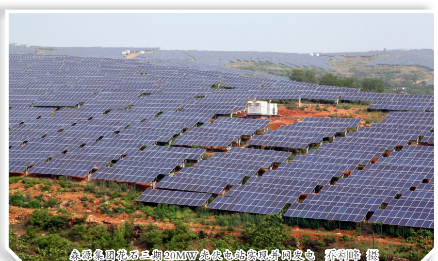
在平顶山光伏产业园 禹州市光伏扶贫电站