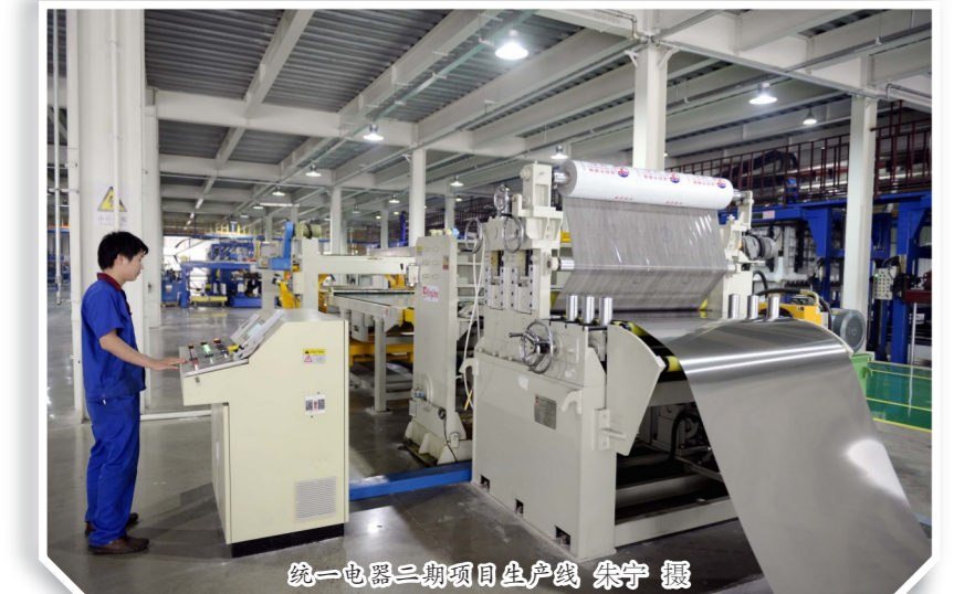
统一电器三期项目生产线

“既严以修身、严以用权、严以律己,又谋事要实、创业要实、做人要实。”习近平总书记就深入推进作风建设,向各级领导干部提出“三严三实”要求,直指人为的根源,切中干事创业的要害。 为促进经济社会持续健康发展,2016年初,禹州市以强化基础支撑、大目标、聚焦大交通、大教育、大水利、大城建、大民生“五大建设”,聚力东部桥河至高铁站区、城西沙陀湖区、城北高陵科教园区、城东医药健康产业园、西部神垕山旅游开发“五大战区”和郑万高铁及站场、城区地下停车场及城市管网等重点工程,推动禹州整体工作持续前进、逆势而上。 战鼓催征,当勇往直前。“五大战区、二十个项目组”涉及的项目,都是事关全局的大事、要事,每一项都不是轻而易举就能获得成功的。之所以把各工作区域以“战区”命名,目的就是要激发禹州市上下的干劲,做到迎难而上、攻坚克难、战无不胜。禹州市市长范晓东说: 为此,禹州市成立了由市委书记任政委、市长任总指挥长的领导机构,成立了禹州市四大班子主要领导干部禹州市产业集聚区管委会主要领导干部任组长的五大战区指挥部,禹州市副市长任组长的12项重点工程推进领导小组。同时,抽调100名优秀中青年干部,脱离原工作岗位,充实到项目建设一线。 为全力推动项目建设,该市将“五大战区、二十个项目组”细化为82个项目,神垕旅游开发项目就是其中之一。老街