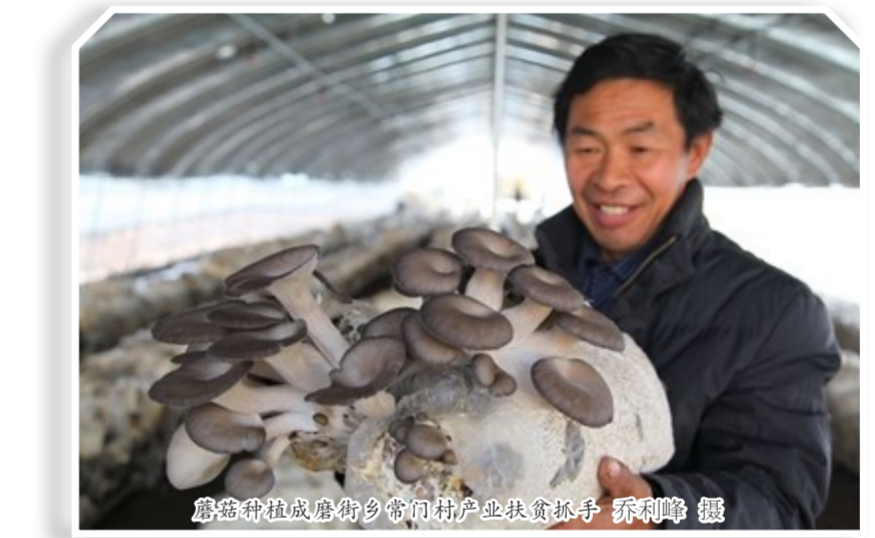
禹州市发展起来的乡村特色产业