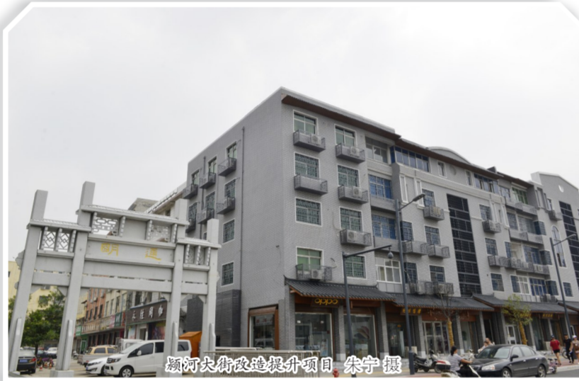
禹州技术改造项目