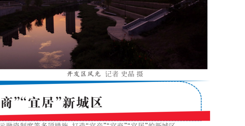
开发区风光

抓牢作风建设，持续深化从严治党新常态。不断强化党内监督，推动正风肃纪常态化。坚持不懈落实中央八项规定精神，驰而不息，正风肃纪，促进作风建设常态化。持续抓好基层党员干部“微腐败”治理，集中力量查处侵害群众利益的案件，持续推进“五大工程”建设，持续打开开发区忠诚干净、有担当的执纪铁军。加大财政资金监管力度，规范资金审批程序，对重点项目、重点领域、涉农领域等专项资金开展审计工作，着力在源头治理腐败问题。