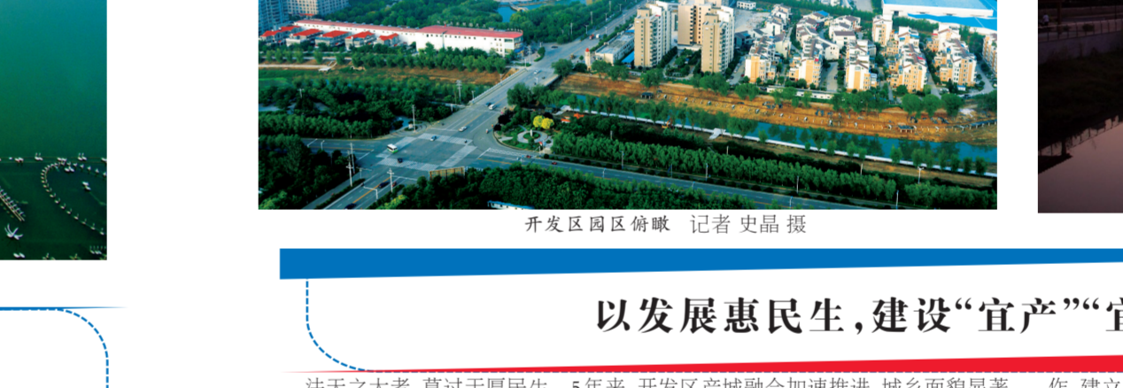
开发区园区俯瞰

抓牢作风建设，持续深化从严治党新常态。不断强化党内监督，推动正风肃纪常态化。坚持不懈落实中央八项规定精神，驰而不息，正风肃纪，促进作风建设常态化。持续抓好基层党员干部“微腐败”治理，集中力量查处侵害群众利益的案件，持续推进“五大工程”建设，持续打开开发区忠诚干净、有担当的执纪铁军。加大财政资金监管力度，规范资金审批程序，对重点项目、重点领域、涉农领域等专项资金开展审计工作，着力在源头治理腐败问题。