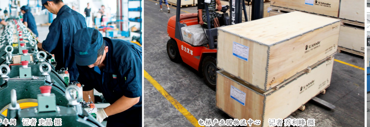
电梯产业园物流中心