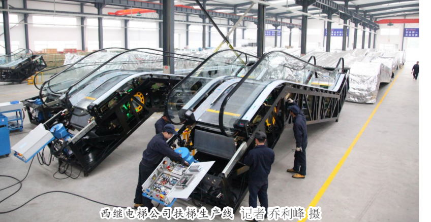
智能电梯机器人

抓牢作风建设，持续深化从严治党新常态。不断强化党内监督，推动正风肃纪常态化。坚持不懈落实中央八项规定精神，驰而不息，正风肃纪，促进作风建设常态化。持续抓好基层党员干部“微腐败”治理，集中力量查处侵害群众利益的案件，持续推进“五大工程”建设，持续打开开发区忠诚干净、有担当的执纪铁军。加大财政资金监管力度，规范资金审批程序，对重点项目、重点领域、涉农领域等专项资金开展审计工作，着力在源头治理腐败问题。