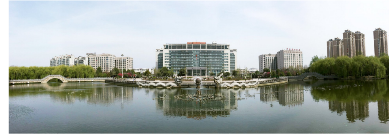
开发区双龙湖游园

抓牢项目建设，持续提升经济发展新态势。突出重点，乘势而上，开发区把项目建设作为工业转型发展的主要抓手，超前谋划要到位，攻坚克难思想要到位，推进机制要到位，加大项目建设力度，着力形成“储备一批、开工一批、投产一批、达产一批”的项目梯次推进格局，以项目建设带动产业做大做强，实现产业集群发展。