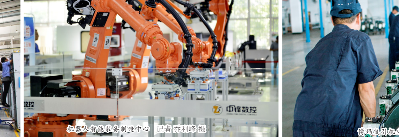
机器人信息装备制造中心