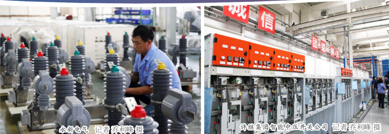
研发设备总装项目建设现场

党的十八大以后，在市委、市政府坚强领导下，开发区党工委、管委会领导班子率领广大干部职工齐心协力、加倍努力、精准发力，按照“高新技术引领、产业特色鲜明、基础设施完善、产城融合发展”的发展定位，突出以产业发展、项目建设、招商引资、社会管理、党的建设等工作重点，统筹推进各项工作开展，推动全区经济社会发展迈上新台阶。