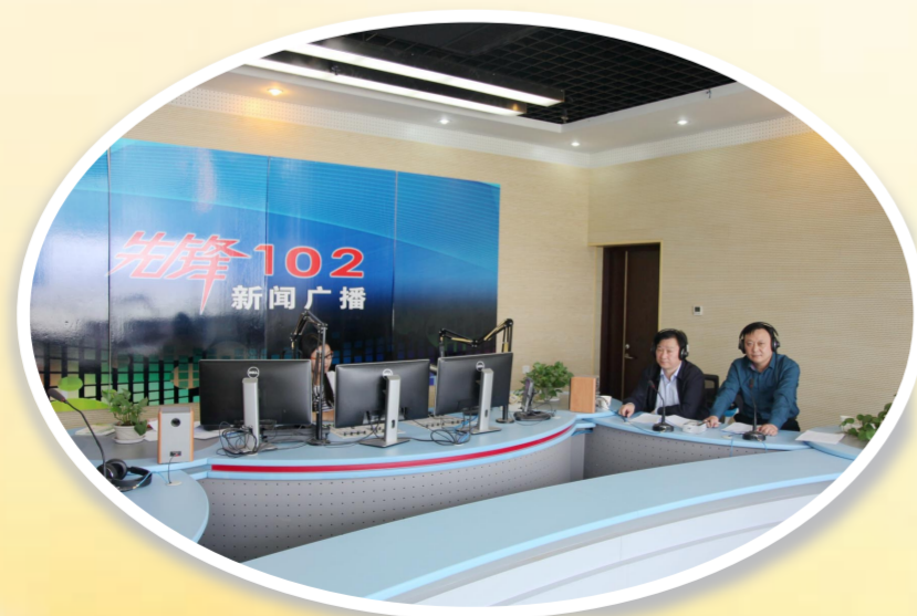
参加行风热线活动解答群众问题