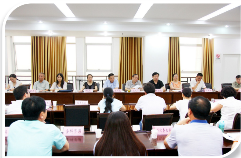
召开降成本征求意见座谈会

金秋十月,这是一个绚丽多彩的季节,也是一个硕果累累的季节。春华秋实,耕耘收获。党的十八大以来,以习近平同志为核心的党中央提出了一系列治国理政新理念新思想新战略,十八届三中全会更是把财政提高到国家治理的基础和重要支柱的高度。我市财政部门深入学习领会习近平总书记系列重要讲话精神,紧紧围绕市委、市政府决策部署,坚持以新发展理念为指导,以供给侧结构性改革为主线,以保障改善民生为重点,不断推进财税体制改革,为全市经济社会发展作出了积极贡献,以喜人的成绩迎接党的十九大胜利召开。