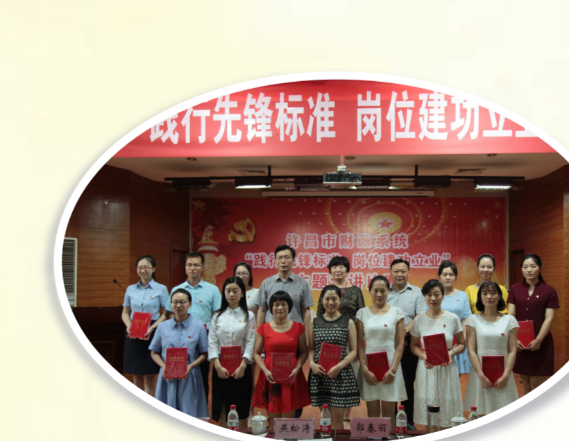
举办“践行先锋标准 岗位建功立业”演讲比赛