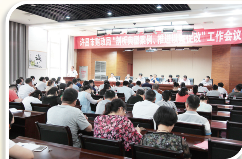
开展廉政警示教育