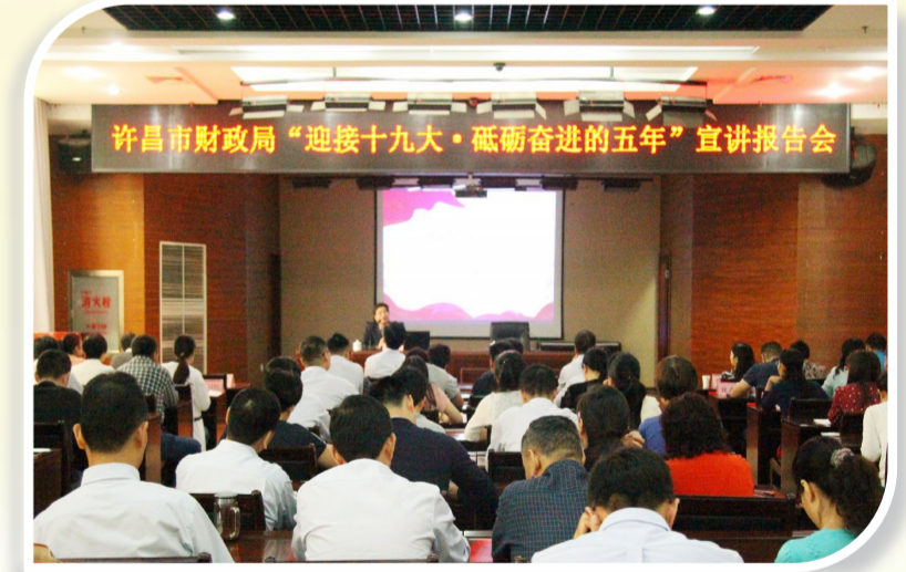
举办“迎接十九大·砥砺奋进的五年”宣讲报告会