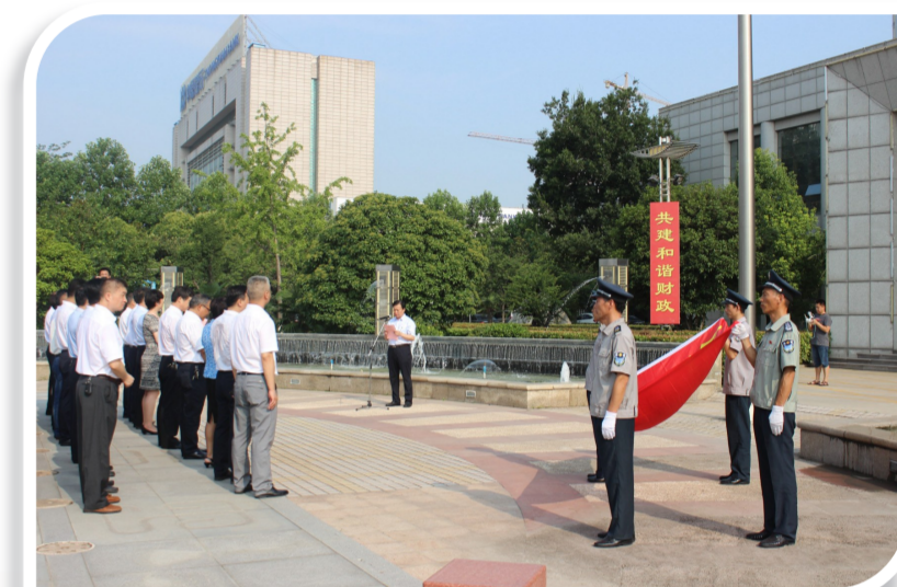
开展“不忘初心重温入党誓词”活动

征程千里风正劲,重任千钧再奋蹄。在党的十九大即将召开之际,市财政部门在市委、市政府的领导下,再启征程,努力谱写财政事业发展的新篇章!