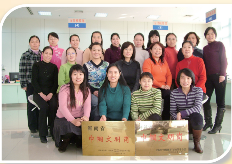
获得省级巾帼文明岗荣誉