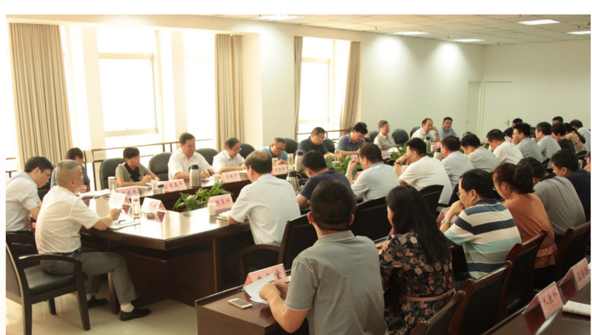
召开中层干部会议部署财政重点工作

支持城市建设。财政部门通过发行城投债、银行贷款、政府和社会资本合作等方式,千方百计筹措资金支持西湖公园提升改造、护城河环通、公共交通系统等城市基础设施和社会公益事业项目建设,使我市城市面貌有了明显提升,形成了“河畅、湖清、水净、岸绿、景美”的城市生态环境。特别是去年年底,财政部门积极与上级有关部门沟通,成功促成与财政部中国政企合作基金、省豫资公司、邮储银行等签订许昌市城市发展“1+5”投融资战略合作协议,构建起全省首个“1个市级+5个县级”PPP投融资公司的完整体系,创造了“许昌模式”,将带动县(市)基础设施投资千亿元以上,成为拉动全市经济发展的新引擎。今年以来,财政部门积极推进百城建设提质工程,据省豫资公司统计,我市获批融资57亿元,占全省百城提质获批额度的25.8%;与省豫资公司合作成立许昌市郑许融合建设发展有限公司,建立机许城市快轨项目专项资金筹集、使用、管理机制,大力支持郑许融合发展。