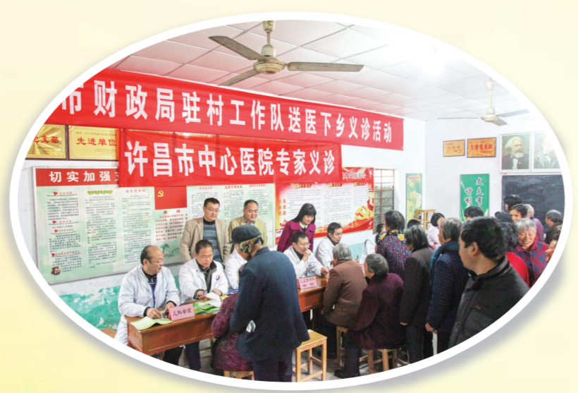
驻村工作队组织开展“送医下乡”活动