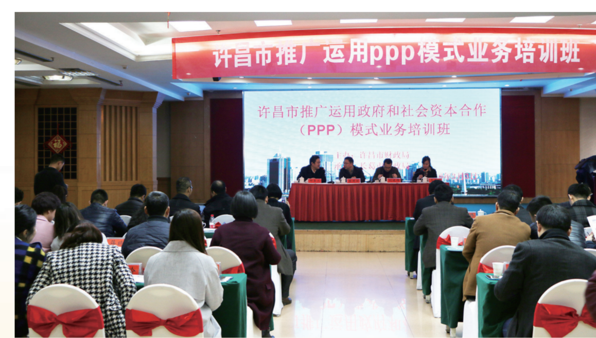
开展推广运用PPP模式专题培训

支持脱贫攻坚。今年以来,市财政部门进一步加大投入力度,全市投入扶贫资金4.5亿元,是去年全年