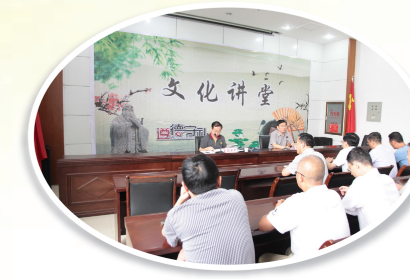
举办财政文化讲堂