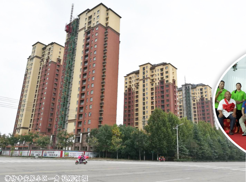
塘坊李安居小区一角