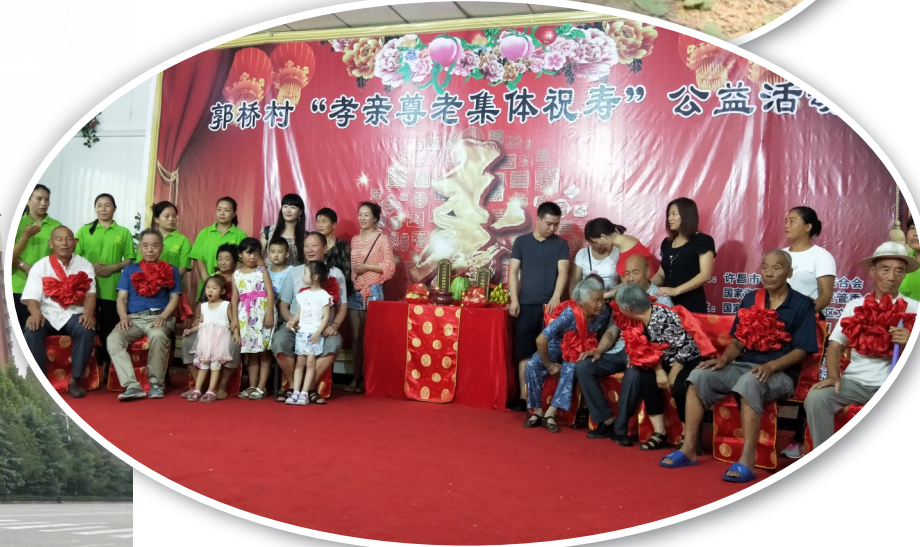
该乡郭桥村集体祝寿活动现场