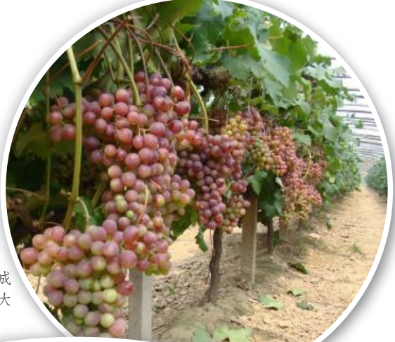
特色农业成为长村张乡一大景观

作，投资200多万元，在环城路以里安排了48名保洁员，购买了3台钩臂车，在主街道安放了75个大型垃圾箱，建了1座压缩站，购买了车辆和设备，乡环城路以内居民居住环境得到较大改善；实施农村道路建设三年行动计划，修建并完善农村道路共34公里，实现了乡至各行政村道路的畅通，有效地解决了广大人民群众的出行难问题。