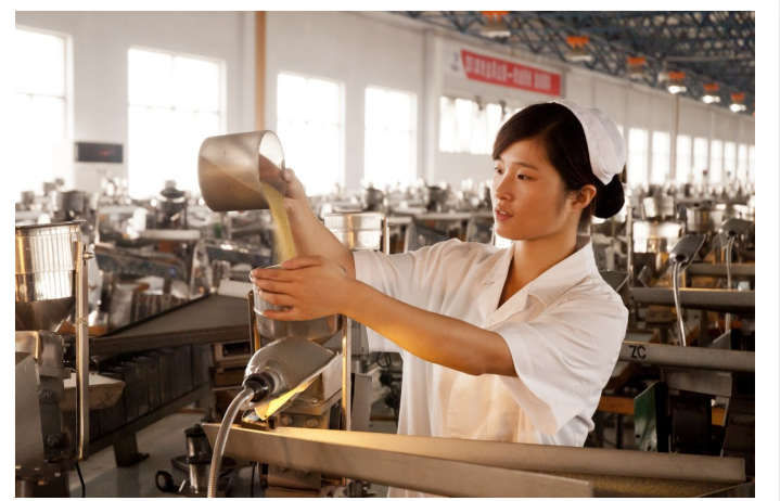
精挑细选金刚石