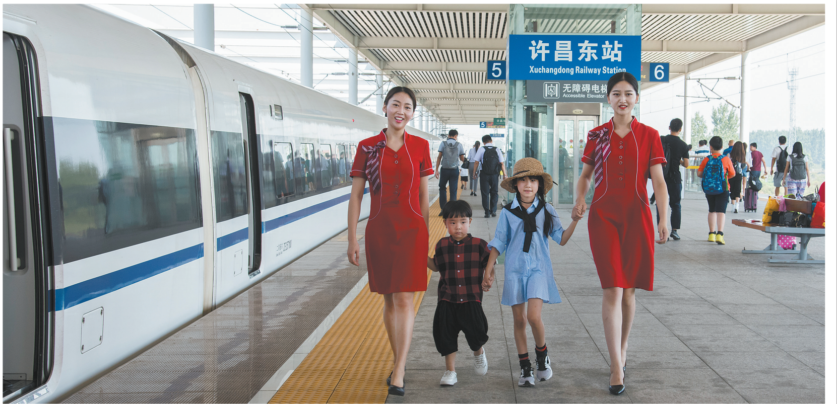
开放的许昌欢迎您