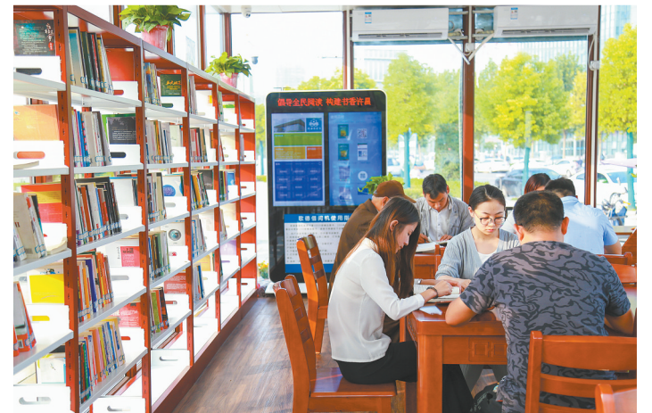
智慧书屋