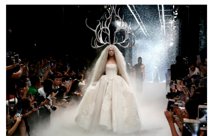
头上时尚