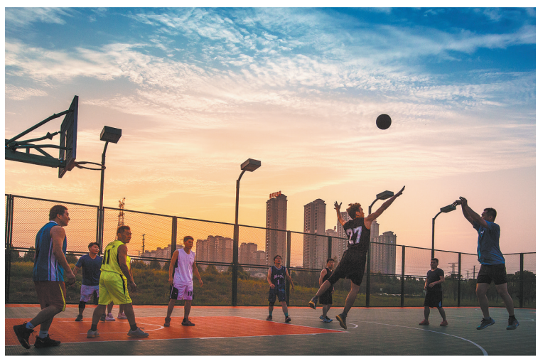
八小时外健身忙