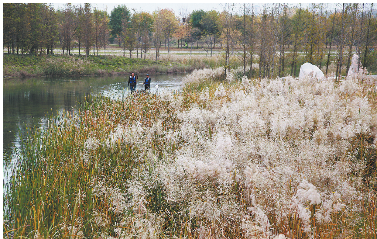
11月11日，市城乡一体化示范区饮马河湿地公园内，芦苇随风摇曳，风景如画。如今，我市加快实施中心城区园林绿化提升项目，推动“绿满许昌”向“多彩许昌”转变，提升了市民群众生活幸福感。