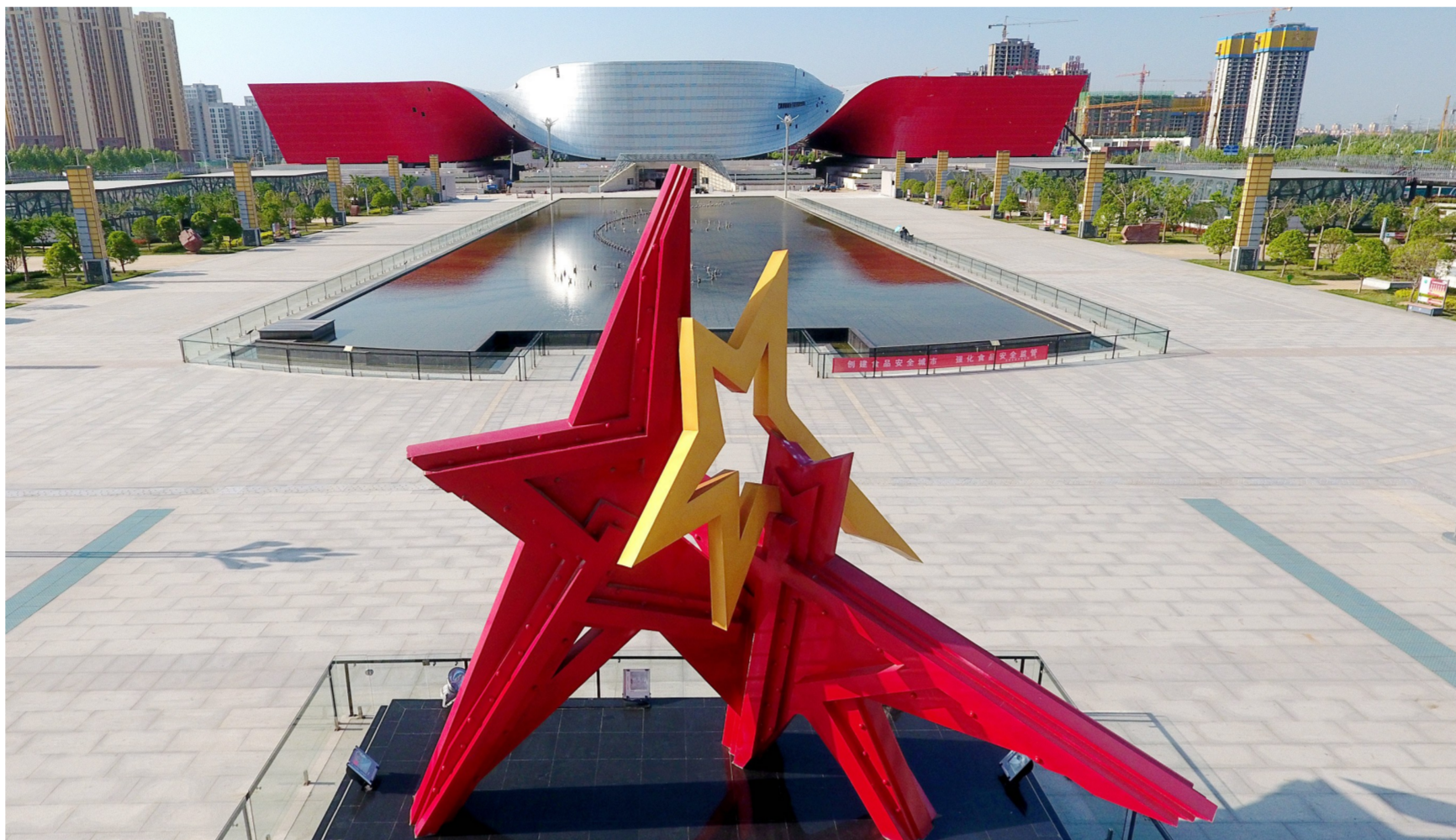
许昌科技广场。