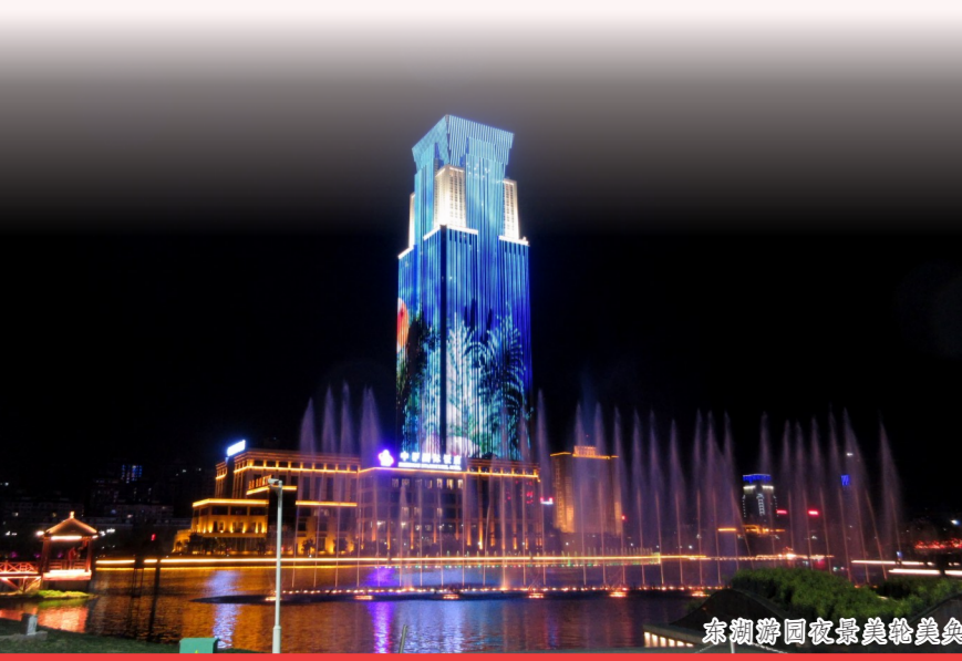
豫商国际购物广场夜景。

2018年,东城区共谋划百城提质项目122个,其中市级项目48个,区级项目74个,总投资820亿元。这些项目既有城市基础设施建设,又有民生改善方面的建设,其中不乏“大手笔”之作。目前,中原·云翔广场、中原公园游园提升、秋湖山地公园和东大街中学等11个项目已竣工。机许城市轻轨、洪河北街、许都路小学和晋庄社区安置小区建设等42个项目正在有序推进。