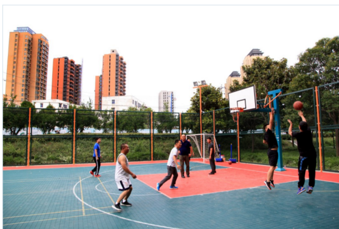
打造“15分钟健身圈”满足市民健身需求。