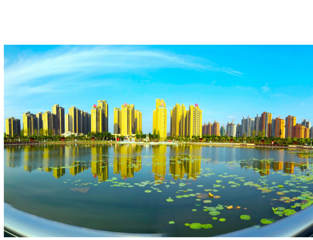
东城区城市建设品质不断提升。

潮平岸阔催人进,风正扬帆正当时。朱发业表示,新时代开启新征程,新时代呼唤新作为。在市委、市政府的坚强领导下,东城区将以敢于担当、勇创一流的精神状态和抓铁有痕、踏石留印的务实作风,大力发扬“三股劲”精神,撸起袖子加油干,拉高标杆、砥砺前行,以党的建设高质量推动经济发展高质量,为许昌在中原更加出彩中走在前列贡献东城区力量。