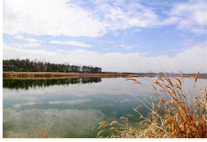
秋湖湿地公园风光无限。