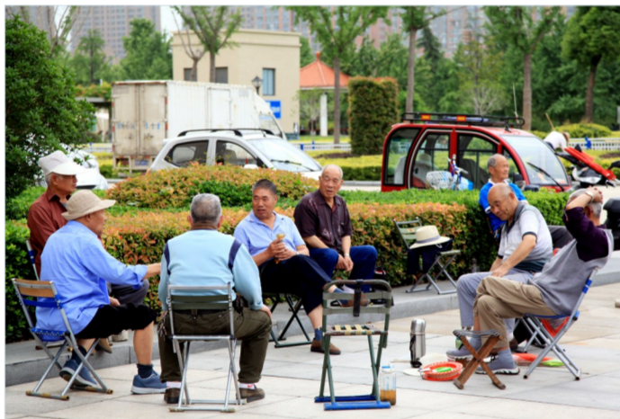
良好的生态环境让市民生活更惬意。