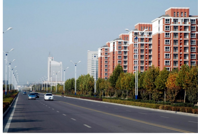
东城区不断完善社区路网建设。