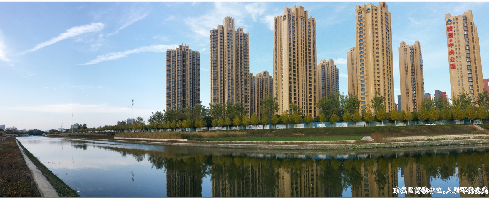
东城区商务楼宇、人居环境宜居。