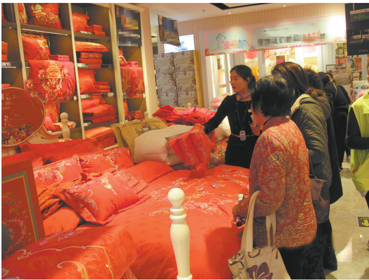
消费者在市区一家居卖场选购产品

如今,市民选购建材越来越理性,从中不难看出消费者对环保装修的要求日渐提高。“只要产品环保、品质优秀、服务贴心、价格实惠,消费者一定会选择我们的。”刘三姐家居生活馆工作人员告诉记者。