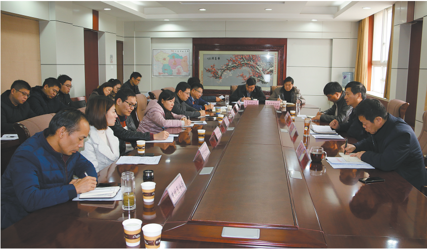
我市不动产登记工作座谈会现场

会上,与会人员逐个发言,分别汇报了农村房地一体调查登记的工作进度和“放管服”改革的实施情况。襄城县不动产登记中心作为“一窗综合受理”的先进典型,在不动产登记工作和“放管服”改革中积极创新、大胆实践,围绕“便民、规范、高效、廉洁”的工作准则,积极推行电话回访制度,建立回访问题解决台账,对每一件已办结事项进行回访,听取企业和业主的意见和建议,取得了良好的效果。禹州市不动产登记中心在“互联网+不动产登记”方面大胆创新,设立24小时不动产登记业务网上受理窗口,办事群众可以通过手机、计算机等终端随时随地直接在网上对不动产登记业务的