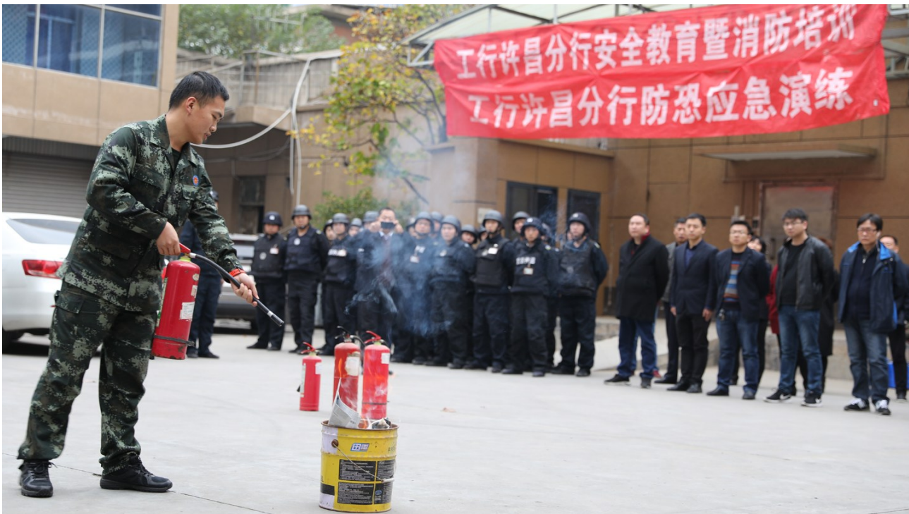
为全面提升消防安全工作,筑牢消防安全屏障,有效提升消防安全意识和应急处置能力,日前,工行许昌分行组织开展消防安全应急演练活动,进一步提高了该行工作人员做好消防安全工作的积极性。

本报记者 李晓 通讯员 刘辉 福彩双色球的蓝色号码为16选1,选中蓝色号码不仅是中大奖的前提,而且选中一个蓝色号码就能中六等奖。因此,彩民在投注双色球时,要重点分析蓝色号码。在实际操作中,彩民可根据蓝色号码的走势,利用以下三种投注技巧,轻松选取蓝色号码。 划分区间选蓝色号码。彩民可以