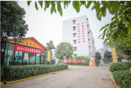
“四改一增”改造后的延中小区