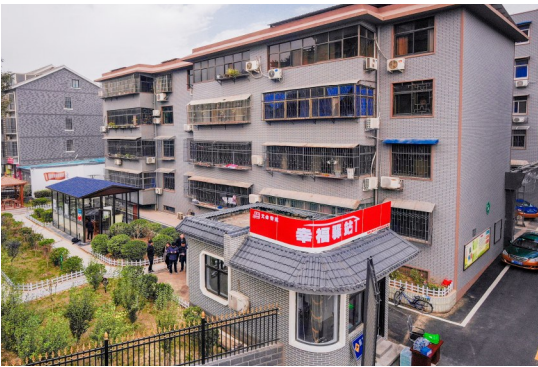
文会警苑的幸福驿站

在老旧小区改造的同时,该区还配套启动了老街道、老厂院、老市场的改造和增加停车位等工作,着力解决群众出行难、停车难、居住环境差等问题,在老旧小区周边,实施了养老、卫生、健身等服务体系建设,把1555项具体事融入了群众、融入了小区、融入了庭院,让老旧小区改造工作在群众的获得感、幸福感中,实现提升、得到检验。