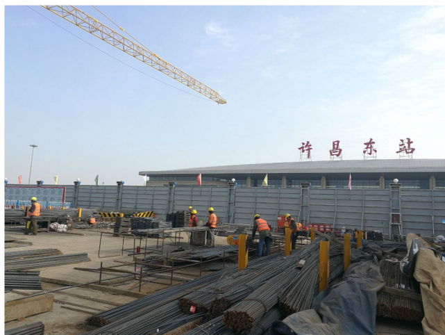
工人们冒着严寒,坚持作业。

“道路安全畅通,让每位市民高兴出门、平安回家,是我们的职责所在。”寒冷的天气,并未阻挡这位50多岁老民警的脚步。提前到岗、延迟下班,民警们无怨无悔。