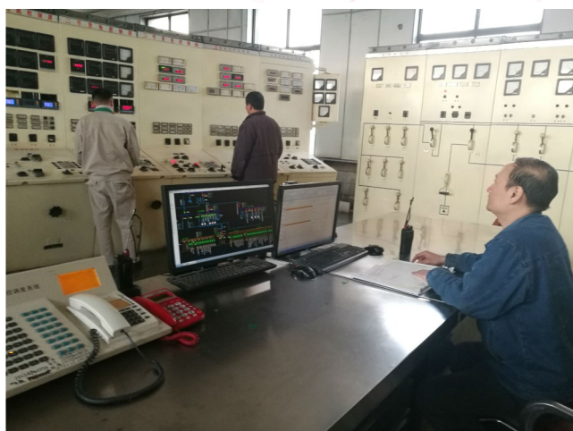
许昌天健热电有限公司职工正在调度室监测供暖数据。

岁寒知松柏。新年第一天,记者感受到了供暖职工的无私奉献。为了市民温暖过冬,他们辛苦了!