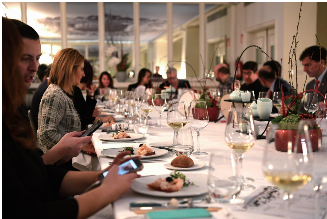
1月25日,西班牙媒体记者和网络美食博主等在马德里一家酒店品尝“行走的年夜饭”中餐菜肴。中国驻西班牙大使馆已连续4年主办“行走的年夜饭”活动,旨在促进中西两国美食文化交流,让更多西班牙民众了解中餐。