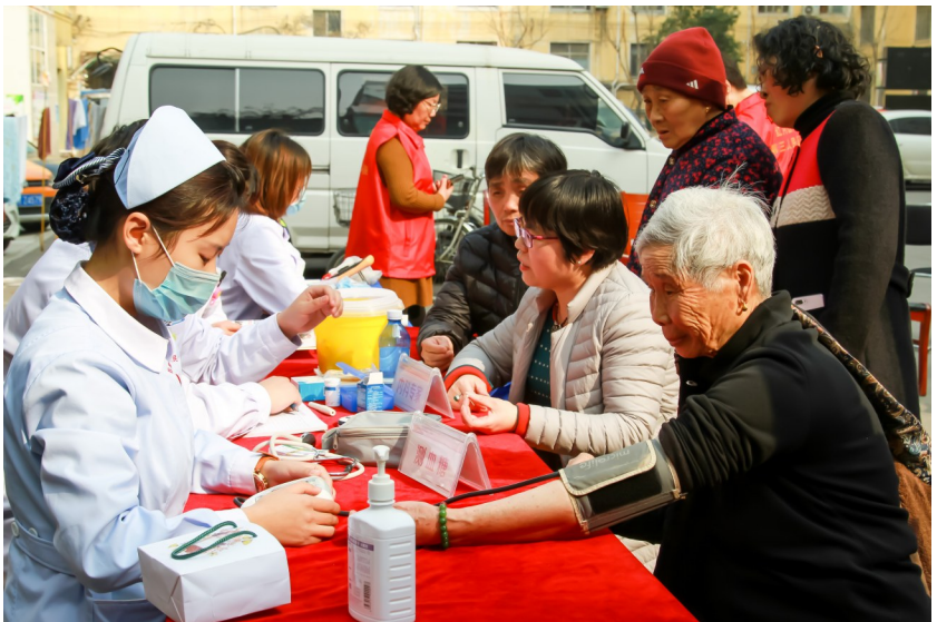
3月5日,许昌市第三人民医院·许昌红月医院医护人员为东大街街道办事处文惠社区居民检查身体。2019年是许昌市第三人民医院·许昌红月医院的“健康科普年”,该院将举办上百场健康科普讲座,增强群众健康意识,提高群众健康水平。

他们与患儿没有血缘关系,却把全部的爱献给了患儿,悉心守护着祖国的花朵。他们是最可爱的人。